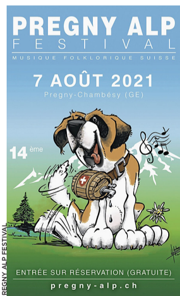
Affiche de l'édition 2021.