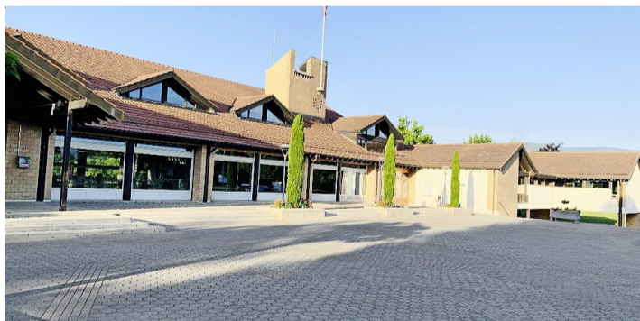
L'école primaire de Corsier. PATRICK JEAN BAPTISTE

Pour mémoire, la décision concernant l'agrandissement de l'école de Corsier remonte à mai