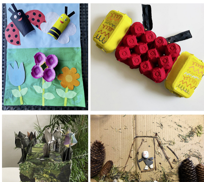
Montage de quatre créations présentées au concours.

Les huit lauréats ont reçu une entrée gratuite pour un centre d'escalade à Versoix et tous les participants ont eu un prix de participation sous forme de bon d'achat à faire valoir dans l'épicerie de quartier.