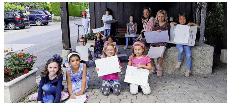
Les artistes de l'Atelier avec Nubia. ANTOINE ZWYGART

Deux stages sont proposés pour les enfants de 4 à 12 ans, du 5 au 9 juillet et du 23 au 27 août, avec visite d'un musée et beaucoup de travaux en plein air et au bord du lac. Inscriptions: Nubia de Schrevel au 079 262 30 43.