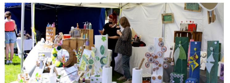
Vue sur un stand du marché de printemps.

Forts de ce succès, les organisateurs se disent prêts à proposer d'autres événements comme celui-ci, notamment le marché de Noël, prévu les 4 et 5 décembre prochains. Caroline Delaloye