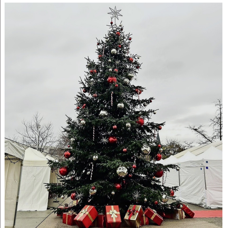
Mon beau sapin, roi des forêts. CORINNE SUDAN

La Commission Manifestations, Sport et Événements a tout mis en œuvre, pour que cette manifestation annuelle soit inoubliable aux yeux des tout-petits et des grands. Corinne Sudan