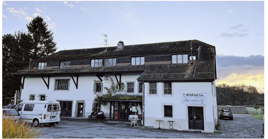
La bâtisse du XIX e siècle sise sur la parcelle. PATRICK JEAN BAPTISTE

Les autorités communales avaient déployé des efforts pour