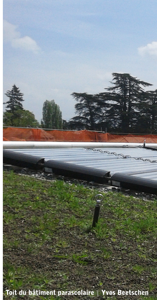
Toit du bâtiment parasolaire | Yves Beetschen