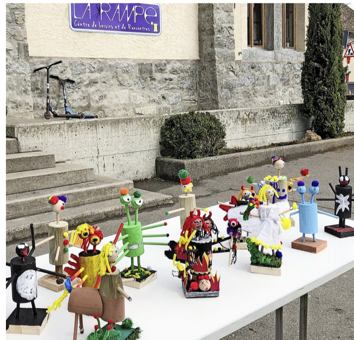
À défaut d'un gros feu, de drôles de personnages. KARINE DARD

bonnes idées de l'équipe d'animation de notre maison de quartier. Ils ont en effet pu fabriquer leur propre petit Bonhomme Hiver durant les moments d'accueil libre de ces trois dernières semaines. Ils ont ainsi assemblé des morceaux de bois pour concevoir leurs monstres/personnages, sans colle ni clou pour qu'ils s'embranchent plus facilement. Les petits esprits créatifs les ont ensuite peints. Il fallait bien patienter encore quelques jours pour les laisser sécher avant de pouvoir les emporter à la maison. Le vendredi 19 mars, les enfants sont donc rentrés chez eux avec leur chef-d'œuvre éphémère. Celui-ci pourra être ainsi brûlé en famille pour célébrer la nouvelle saison. Cependant, en voyant ces magnifiques créations, pour lesquelles les enfants se sont tant investis, j'ai quand même un doute: cette année - c'est ma main que je mets au feu! -, les Bonhommes Hiver ne subiront pas le même sort que leurs géants