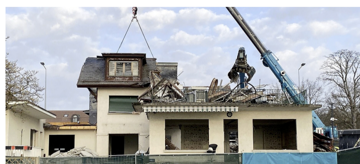
Le chantier a commencé. CAROLINE DELALOYE

Les habitants de Bellevue sont nombreux à avoir vu disparaître ces maisons avec une certaine émotion. Ces propriétés ont en effet été rachetées par la Commune en 2015 et 2016 afin de pouvoir construire des bâtiments en grande partie dédiés aux Bellevistes et harmoniser ainsi les constructions du bord du lac. Virginia et Louis Currat ont vécu dans la maison du 316, construite en 1880. Lors de son acquisition en 1998, ils ont appris