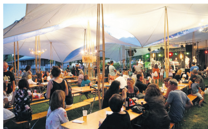
Une belle ambiance devant la scène, sous la tente tenue avec des bambous. COMITÉ FESTIBEL'

L'espoir est de créer des synergies entre les différents acteurs et participants de la manifestation. L'élan de solidarité autour du repas communautaire du dimanche midi - préparé avec les invendus des enseignes locales et les légumes offerts par l'Union maraîchère genevoise - permet de reverser le bénéfice des ventes à une