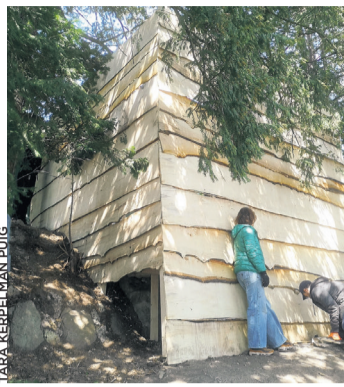
Bains du Saugy éphémères.