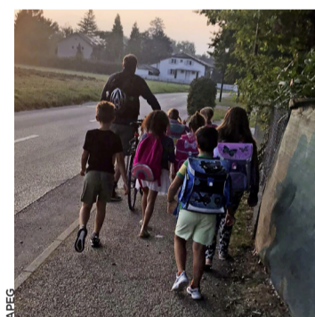
La ligne Pedibus en 2020.