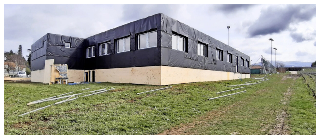
La mairie provisoire lors de sa construction. ANTOINE ZWYGART

Anières va entreprendre de grandes réalisations ces prochaines années, la législature précédente ayant validé de nombreux projets d'avenir pour notre commune. Notre législature actuelle les réalise, nous offrant de nouvelles infrastructures pour le bien des générations futures.