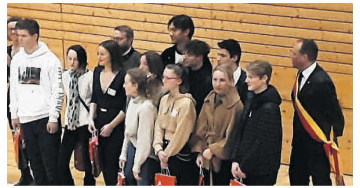
Nos jeunes citoyens entourés du maire et de ses adjoints.