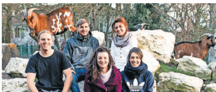
L'équipe du Bioparc Genève. BIOPARC GENEVE

L'institution a été créée en 1991 pour la conservation de la biodiversité