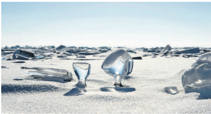
Ici, le froid, le vent et le soleil jouent ensemble pour créer des sculptures de glace.

Pour la deuxième fois à Genthod, Nicolas Pernot, photographe et vidéaste, nous transporte dans un autre monde avec son premier sujet, «Lac Baïkal Perle de Sibérie». À travers une narration en direct de ses propres photos et vidéos, nous voyageons non seu-