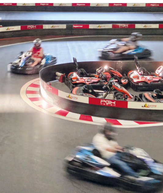
Sortie Karting | juillet 2025