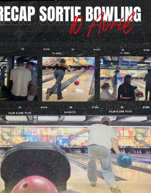
Sortie Bowling | avril 2025